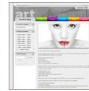
fine art imaging