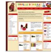
Trolle & Wolle